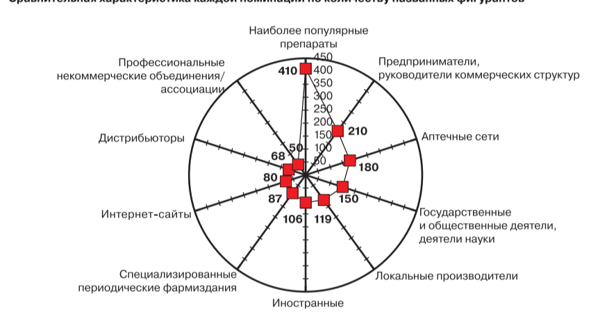
Сравнительная характеристика каждой номинации по количеству названных фигурантов