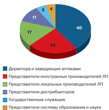
Распределение респондентов по экспертным группам, %