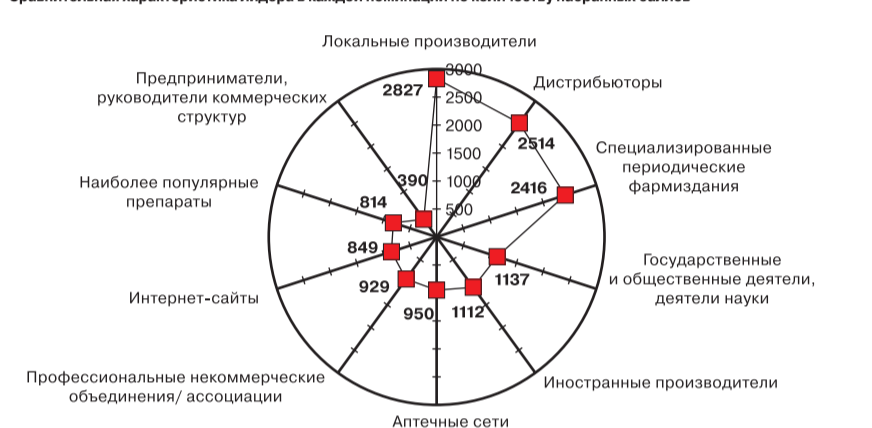
Сравнительная характеристика лидера в каждой номинации по количеству набранных баллов

выборка — 630 респондентов из 36 городов России, декабрь 2014 г.