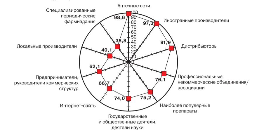
Сравнительная характеристика лидера в каждой номинации по отрыву в рейтинговом балле от ближайшего конкурента, %

Источник: RNC Pharma; выборка — 630 респондентов из 36 городов России, декабрь 2014 г.