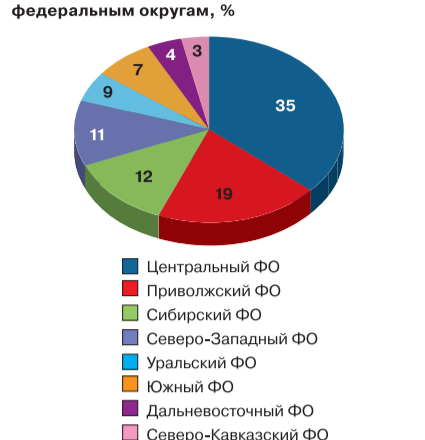
Распределение респондентов по федеральным округам, %

Источник: RNC Pharma; выборка — 630 респондентов из 36 городов России, декабрь 2014 г.